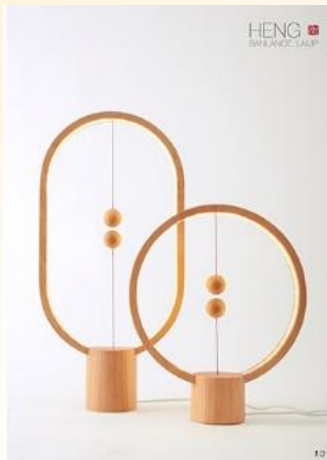
衡 李贊文/中國大陸